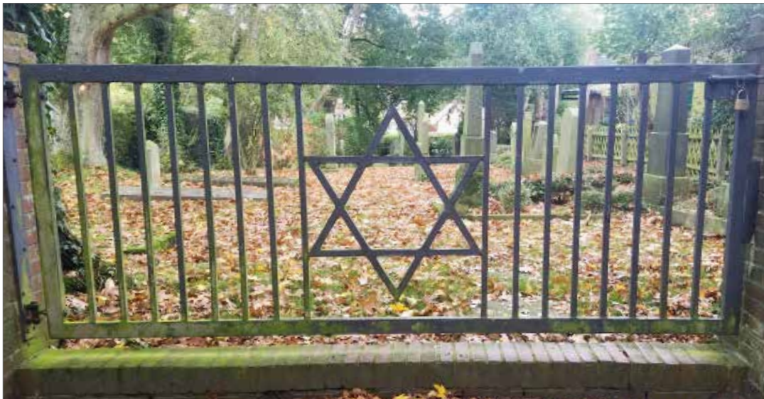
Eingangstor des jüdischen Friedhofs in Dornum.

Die Wahrheit der Aussage meines Freundes wird durch einen Vorfall illustriert, der sich 1961 in Jerusalem ereignete. Adolf Eichmann, der SS-Offizier und Oberaufseher des Holocaust, stand nach der Entführung durch israelische Agenten aus