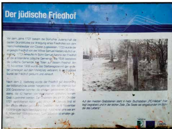
Gedenktafel am jüdischen Friedhof in Dornum

rufen wurden, um ihre Aussage zu machen, mussten sie direkt dort vorbeigehen, wo Eichmann in seinem gläsernen Käfig saß. Als einer der Holocaust-Überlebenden an ihm vorbeiging, begann er plötzlich zu zittern und brach zusammen. Doch dann stand er wieder auf und machte vor dem Richter seine Aussage. Nach der Verhandlung wurde er gefragt, warum er zusammengebrochen sei. Überkam ihn die Angst? Hat er sich an einen Fall von Brutalität erinnert? Erinnernte er sich an irgendeinen Horror von Eichmann?