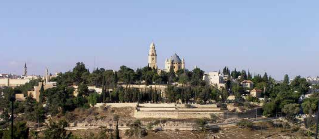
Jerusalem – Altstadt und Mauern mit Berg Zion, Foto: Wikipedia