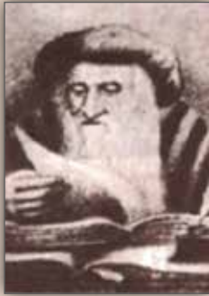
Shlomo Yitzhaki (Rashi)

In den letzten 1700 Jahren haben ununterbrochen Juden in dem Gebiet gelebt, das heutige Deutschland umfasst. Diese andauernde jüdische Präsenz ist einzigartig unter den anderen großflächigen Ländern Europas. Aus England, Frankreich, Spanien und Italien wurden die Juden während des Mittelalters vertrieben. Folglich gab es in diesen Gebieten bis ins späte 19. und frühe 20. Jahrhundert hinein kaum jüdisches Leben.