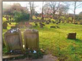
Jüdische Grabsteine auf dem Friedhof genannt Heiliger Sand in Worms