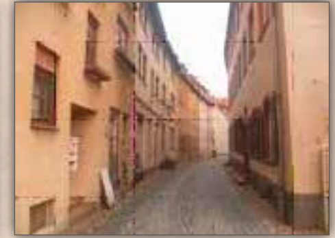
Judengasse in Worms