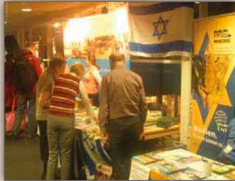
Büchertisch von Ariel Ministries Deutschland während des Israel Kongresses in Berlin 2013