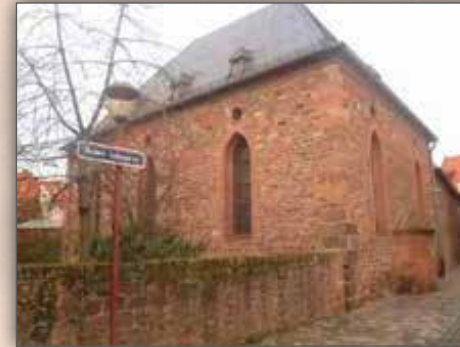
Alte Synagoge in Worms

Dieser Ausschnitt wurde dem Manuskript 040 (Die Königreichsgleichnisse) entnommen.