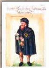
Jüdischer Mann – Worms – 16. Jahrhundert